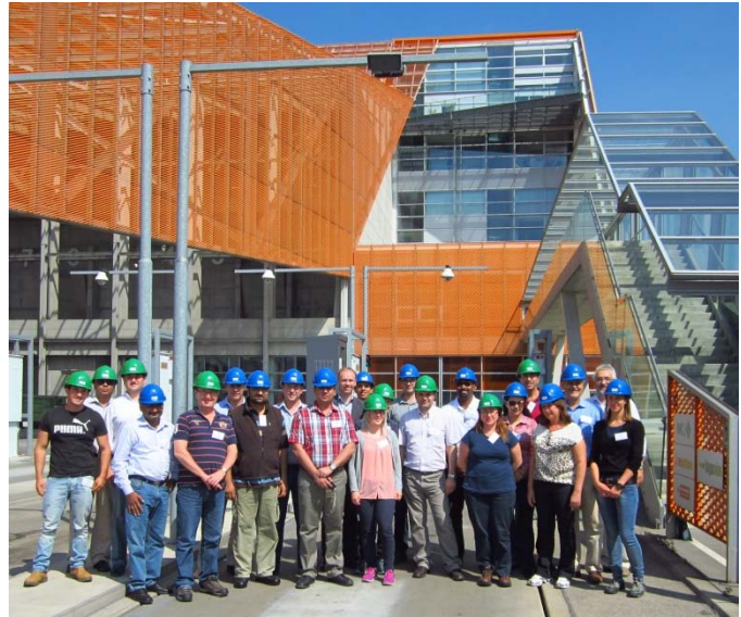
TeilnehmerInnen der Study Tour vor der MVA Pfaffenau, Wien

Auf dem Programm stand diesmal der Besuch von insgesamt 10 Abfallbehandlungsanlagen überwiegend in Ostösterreich, wobei auch eine Anlage in Tschechien (Brünn) in die Tour eingebunden wurde.