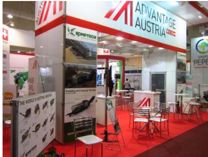
Messestand österreichischer Hersteller bei der RWM Trade Fair, Sao Paulo