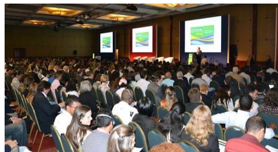
„Opening Ceremony“ des ISWA Weltkongresses

Den Teilnehmern wurde ein umfangreiches Programm geboten: