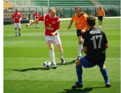
ISWA Football Tournament

Die Kongressunterlagen wie Präsentationen, Papers sowie Poster stehen auf der Kongresshomepage zum Download bereit ( www.iswa2014.org ). Dazu ist folgendes Login zu beachten: