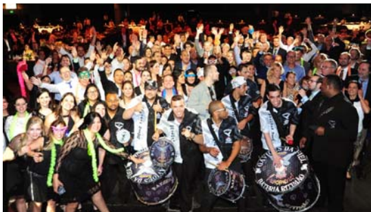
Gala Dinner mit brasilianischer Carnival Party

220 Präsentationen in 55 Sessions, ergänzende Veranstaltungen wie das IPLA Global Forum und die RWM Trade Fair, ein Gala Dinner mit typisch brasilianischer Carnival-Party, Exkursionen zu Abfallwirtschaftseinrichtungen in Sao Paulo sowie einem Fußballturnier zum Ausklang des Kongresses.