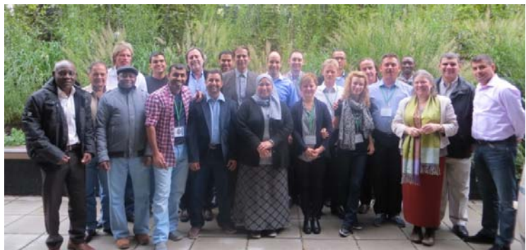
TeilnehmerInnen der Study Tour „Collection, Sorting & Recycling“

Die Teilnehmer konnten somit auf Basis der österreichischen Erfahrungen in der getrennten Sammlung und Verwertung auch die weltweiten Erfahrungen untereinander austauschen. Ein Aspekt der von den Teilnehmern sehr geschätzt wurde.