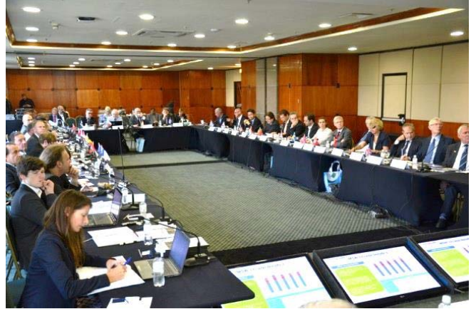
ISWA Generalversammlung 2014 in Sao Paulo

Dies wurde erst jüngst im Zuge der Maßnahmen zur Eindämmung der Ebola-Epidemie deutlich. Hier wurde die ISWA Working Group on Healthcare Waste von der WHO um Unterstützung ersucht, für die betroffenen Gebiete Richtlinien zur Abfallbehandlung auszuarbeiten.